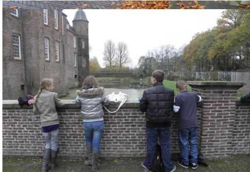
Staat die toren echt scheef of moet ik hem recht tekenen?