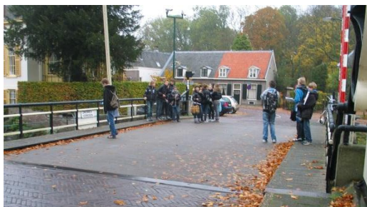
Hoe moet je nu een brug opmeten?